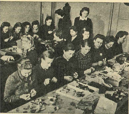
Muiden kurssien ohella sotalleskiä opetetaan myös valmistamaan tekokukkia.