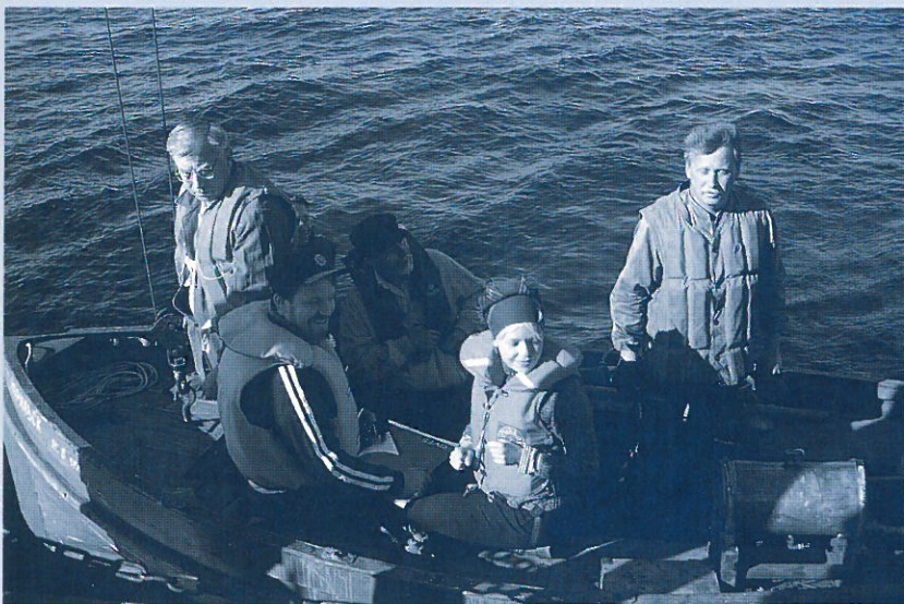
Matka kohti Heinäluodon majakkaa alkaa väyläalus Norilskin pelastusveneellä.

Retkikuntamme jatkoi matkaansa vielä Mantsinsaaren ohi Lunkulansalmeen ja seuraavana päivänä Valamoon ja edelleen sieltä takaisin Sortavalaan. Mantsinsaaren päässä nähtiin jälleen yksi vanhoista edelleen käytössä olevista loistoista.