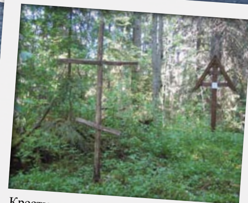
Кресты на месте часовни в Тьюёмпайнен