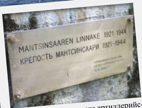
Памятная доска на месте артиллерийской батареи в Хяркямяки