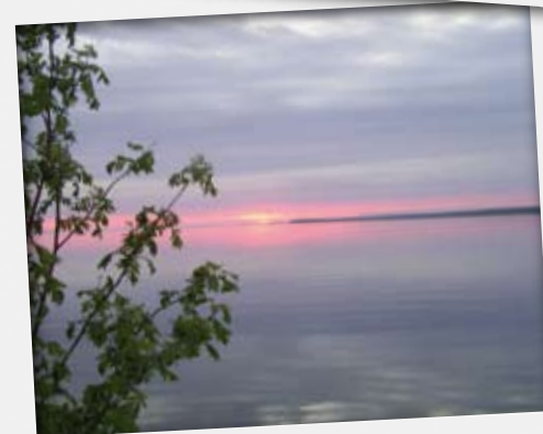
Вид с причала