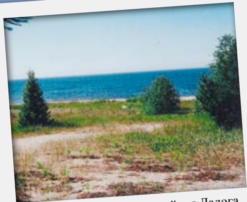
Песчаная дюна и бескрайняя Ладога. Вид с залива Лонкоинлахти